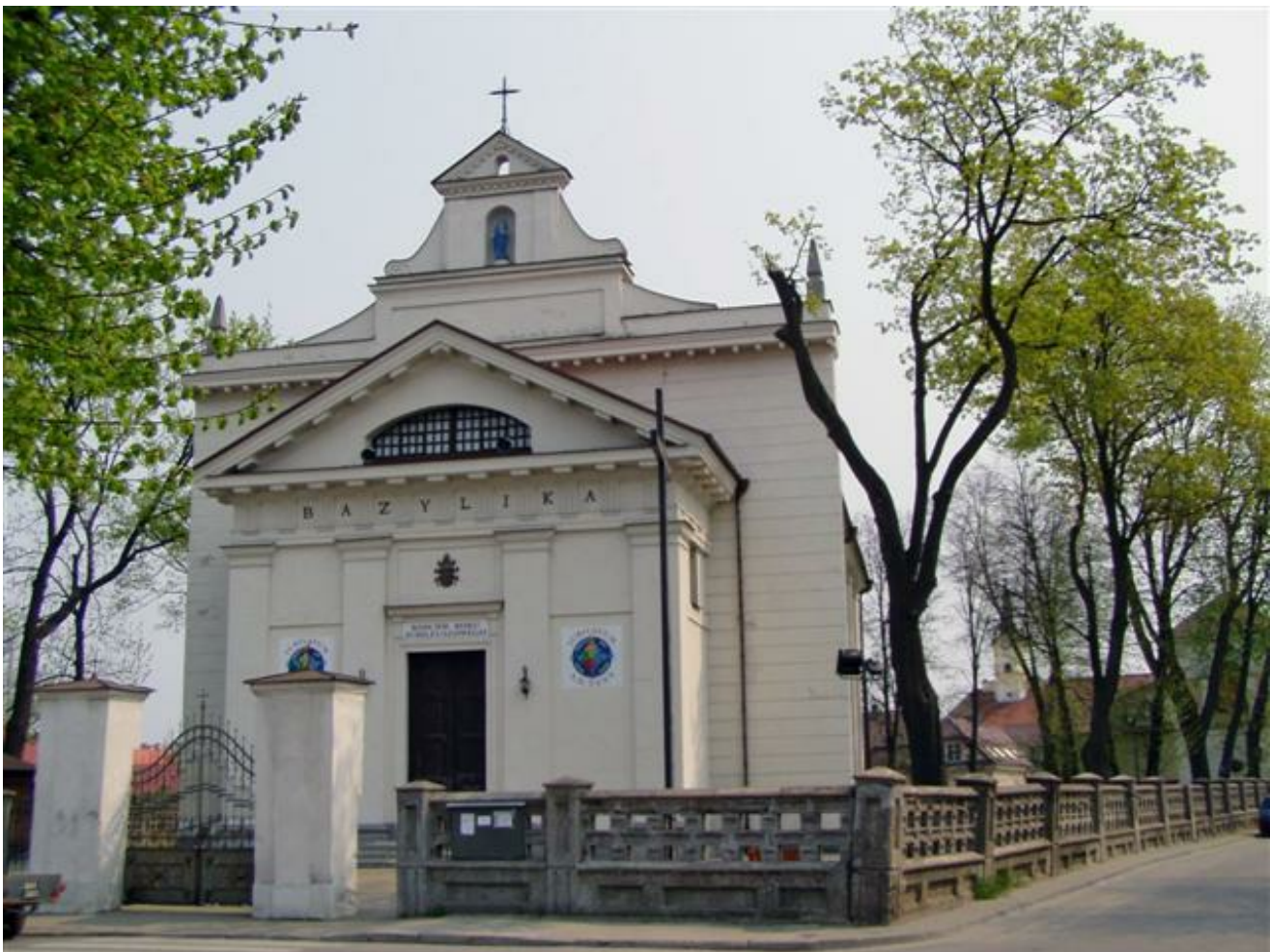
Bazylika Mniejsza pw. Narodzenia Najświętszej Maryi Panny i św. Mikołaja (fot. B. Komarzewski)

Pierwsi ludzie mieszkali już tutaj w pradziejach. Stałe osadnictwo rozpoczęło się we wczesnym średniowieczu. Miejscowość znana z wpisów do ruskich letopisów z połowy XIII w. Pierwszy raz Bielsk wymieniono w dokumencie politycznym w 1366 r. Wówczas wchodził on w skład państwa litewskiego. Tereny te najeżdżały wojska krzyżackie, a rywalizowało o nie też Mazowsze. Drugiego stycznia 1430 r. wielki książę litewski Witold ustanowił i uposażył tutaj wójta miejskiego. Bielsk był już wówczas rozwiniętym ośrodkiem gospodarczym i handlowym na szlaku z Korony na Litwę i z Brześcia na Zachód. Był też „stacją” królewską na trasie z Krakowa do Wilna. Osiemnastego listopada 1495 r. uzyskał przywilej magdeburski. Niebawem wykształciły się władze miejskie z dwoma burmistrzami, ustalono herb miejski – woła w biegu. Do znacznej zamożności doszedł miejscowy ród mieszczański Sieheniów. Miasto było siedzibą starosty hospodarskiego, który zarządzał okolicznymi dobrami i puszciami. W 1501 r. odbył się tutaj zjazd panów rady litewskiej w sprawie elekcji Aleksandra Jagiellończyka i unii z Koroną. Inny, podobny zjazd, odbył się w 1564 r.