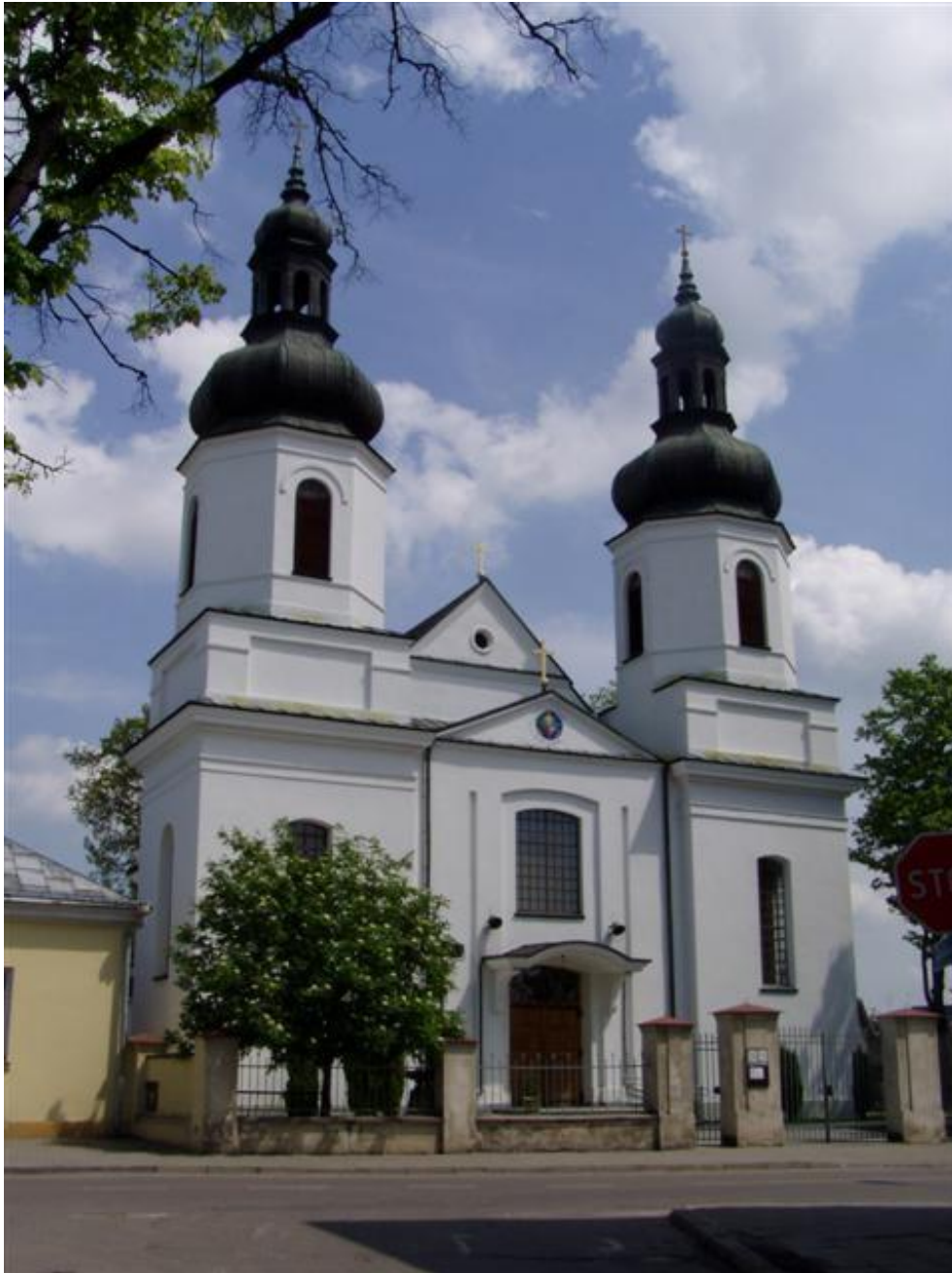
Kościół pw. Matki Bożej z Góry Karmel

klasztór i świątynię, obiekty zachowane do dzisiaj. Władze pruskie skasowały zakon na początku XIX w.