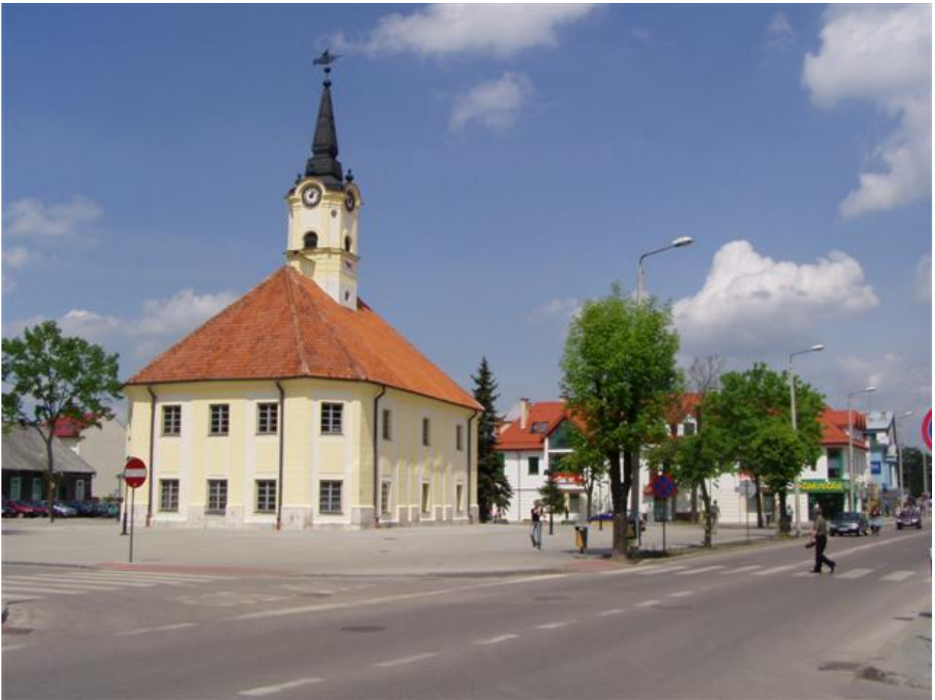
Ratusz z 1779 r.

W 1839 r. administracyjnie zniesiono Kościół unicki, a wyznawców włączono do Cerkwi prawosławnej.