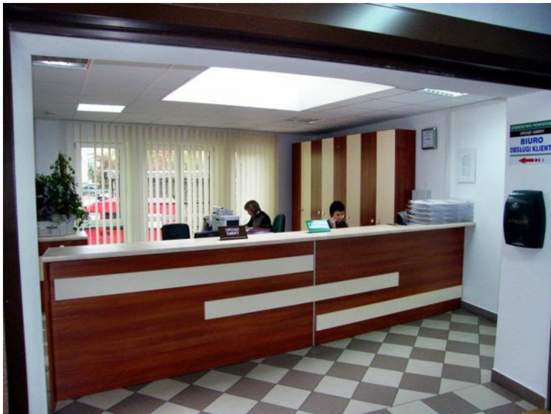
Biuro Obsługi Klienta, ul. Mickiewicza 46, parter, tel.: 85 833 26 16

Starostwo mieści się w trzech lokalizacjach. Posiada również Biuro Zamiejscowe w Brańsku.